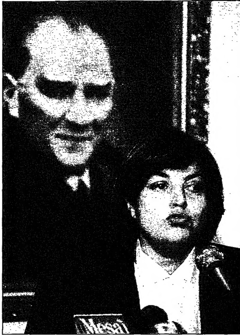
تاسو تشيلر امام صورة لكامل اناتورك في مؤتمره الصحفي

أنقرة - من هيرفيه كورتوييه: بدأ رئيس الوزراء التركي الإسلامي نجم الدين أربكان أمس الثلاثاء محزلاً أمام مطالب العسكريين الذين يمارسون ضغوطاً عليه لوضع حداً لتصاعد نشاطات الإسلاميين في تركيا، وبات أمام خيارين: إما تخليط مطالب الجيش أو الاستقالة. ولم ينجح أربكان في الحصول على دعم الشخصيات السياسية التي بدأ مشاورات معها الاثنين في محاولة تقايرة التصدي لرغبة الجيش الذي يرفض رئيس الوزراء الرضوخ لأوامره باسم الديمقراطية. وتصريحاً من حزب اليسار الديمقراطي وحزب الشعب الجمهوري بولنت جاويد (معارضة يسارية) أربكان بين يمينه بان الدولة علمانية وأن يستقيل. كذلك قال زعيم حزب الوطن الأم (يميني) مسعود يلماخ إنه سيكرس ذلك أيضاً أمام أربكان لدى اجتماعه بهم. كما رفضت وزيرة الخارجية التركية رئيسة حزب الطريق القومي (يميني) دعم أربكان في ختام لقاء عقده مع مساهم الاثنين والتمت بتصريحات حذرة فقالت من الخطأ إضفاء الطابع السياسي على الدين. ويدين على تشيلر أن تأخذ في الاعتبار استياء داخل حزبه وغيره من الأوتة الأخريرة عدت من الأعضاء الذين أعربوا عن معارضتهم للنشاطات الإسلامية التي يقوم بها حزب الرفاه بزعامة أربكان. وبعد يوم الجمعة يندمج كقولنا أربكان أيضاً على الاستقالة في حال رفضه التوقيع على قرارات مجلس الأمن القومي وهذا المجلس هيئة استشارية تضم كبار المسؤولين السياسيين